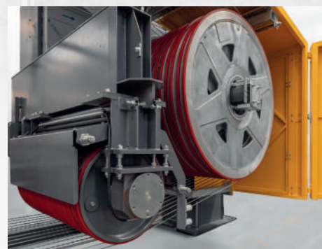
VOLANI LATO TENSIONAMENTO FLYWHEELS TENSIONING SIDE

• Innovative geometry: only 1 motor drum (diameter 1 m), 16 tensioning wheels (diameter 1,5 m) and two small guide drums (diameter 0,6 m) allow a simple and reliable management of the wires. • Simple and easy access to the various parts of the machine through large carter and a comfortable working platform reachable via safety stairs. • Simple and easy positioning of the wires process: the thicknesses change is possible thanks to a fast and manual moving of the wheels along the shaft with insertion of open spacers among the wheels. • Patented tensioning system, installed and utilized on all multiwire machines produced by Pellegrini in the years. • Auxiliary facilities like lubrication and regulation services are available to the operator in a very reduced space: everything is easily under control! • User friendly Touch Screen interface: the control panel show all the needed information and parameters to the operator to simplify the management of the machine. • MAGICWIRE 16 XL version allows to cut 1,5 m block in one shot. With 16 wires it is possible to cut 16 slabs of large thickness.