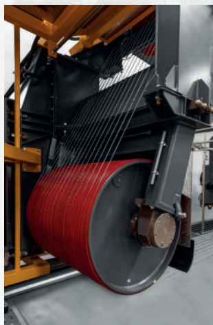
LATO MOTORE MOTOR SIDE

• Geometria di taglio con soli 4 rotori: un tamburo motore (diametro 1 mt), 16 volani tenditori (diametro 1,5 mt) e due tamburini (diametro 0,6 mt) per una gestione semplice e affidabile dei fili. • Accesso semplificato alle varie parti della macchina attraverso grandi porte e piattaforma di lavoro sostenuta da comode scale: manutenzione semplice e veloce garantita. • Operazione di cambio posizionamento dei fili semplice e veloce: la regolazione degli spessori sul lato tensionamento è realizzata attraverso lo spostamento manuale dei volani lungo l'albero e l'inserimento di distanziali aperti tra ciascuno di essi. • Sistema di tensionamento brevettato e collaudato su svariate macchine da alcuni decenni. • I servizi ausiliari (lubrificazione e regolazioni) sono concentrati in uno spazio ridotto: l'operatore ha tutto sotto controllo. • Interfaccia operatore "Touch Screen" immediata ed intuitiva: il pannello comandi fornisce all'operatore tutte le informazioni dello stato della macchina. • La versione "XL" garantisce una copertura di taglio di 1,5 mt e quindi la possibilità di tagliare con 16 fili lastre molto più spesse.